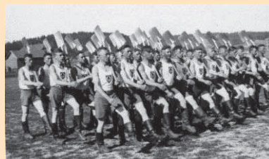
Musztra z łopatami w obozie Arbeitsdienstu 1943r., 1944r.