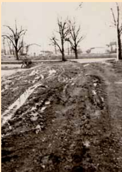
ul. Rubinowa, 1966r.

wielu przypadkach sprawdziła się „samopomoc” rodzinna i zasada tzw. „odrobku wzajemnego”. Do wiosny 1966. roku nie było tu energii elektrycznej, do połowy lat 70-tych utwardzonych dróg i kanalizacji a wodociąg powstał dopiero w roku 1988. W 2010. roku ilość mieszkańców tej dzielnicy przekroczyła 900 osób (prawie 20% populacji Kobióra). Gdy teraz, po 40. latach rozpoczęła się modernizacja infrastruktury technicznej tej części Kobióra , niezależnie od dyskusji i wątpliwości czy spełnia ona nasze oczekiwania, zachęcam do refleksji i pamięci o tych którzy stworzyli to miejsce „z niczego” i już niestety odeszli. Jestem przekonany, że Bóg wynagrodzi im wielki wysiłek jaki ponieśli by pozostawić po sobie trwały ślad na tej ziemi.