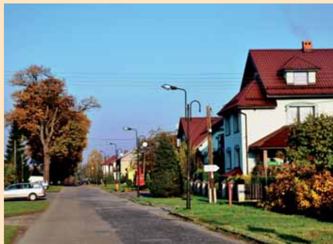
ul. Żołędziowa, 2008r.

jarzyła się z niemieckimi korzeniami i świeżą pamięcią o wojnie i okupacji polskiego śląska. W tym czasie komunistyczna propaganda intensywnie podgrzewała atmosferę zastraszania przed groźącym niemieckim rewizjonizmem. Lata 1960-1970, mojemu pokoleniu kojarzą się z lasem prymitywnych wyciągów budowlanych wystających ponad górne krawędzie powstających jak grzyby po deszczu „kostek” budynków. Zachowało się w pamięci niezwykle poświęcenie naszych rodziców, którzy ulegli wizji zapewnienia właśnie nam, „dachu nad głową” i lepszych warunków życia. Wszystkie domy zbudowano systemem „gospodarczym” w czasie wolnym pomiędzy snem a ciężką pracą zawodową; w